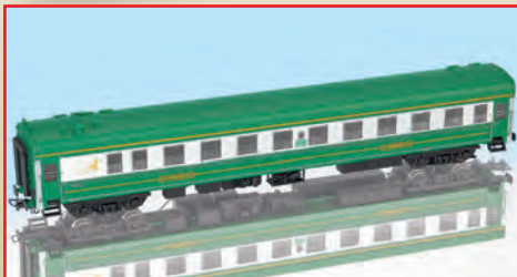
“New Silk-Road Express Train” : aus Set 17092