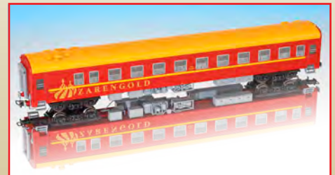
“Zarengold” : aus Set 17094

Durch Umbauten entstanden aus Ammendorfer Wagen zwei Luxuszüge, der “Zarengold” und der “New Silk-Road Express”. Beide Züge richten sich an Touristen, die das Besondere suchen und dabei komfortabel reisen wollen. Luxuszüge, die sich bei Eisenbahnfreunden besonderer Beliebtheit erfreuen.