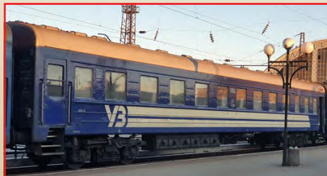
“Ukraine” : aus Set 17102